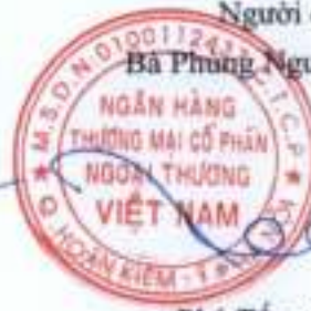
Phó Tổng Giám đốc